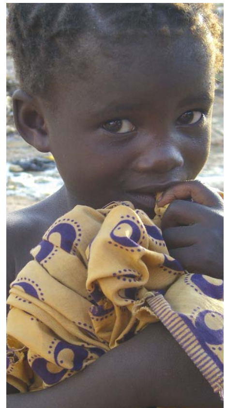
Una bimba del progetto di adozione a distanza realizzato a Manungu, nella periferia di Monze, in Zambia.

Nel 2007 abbiamo dato un piccolo ma concreto contributo alla salvaguardia dell'ambiente . Sono stati installati sul tetto degli uffici della Fondazione i pannelli solari con cui viene generata una potenza sufficiente per l'illuminazione e per alimentare tutti i PC.