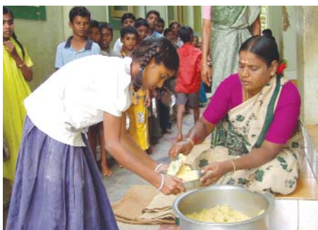
La distribuzione del pasto in una scuola del Gujarat in India.