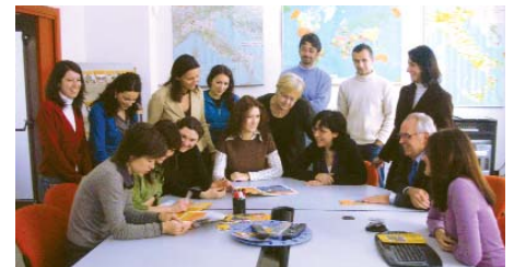
Alcuni collaboratori di "aiutare i bambini".

La Fondazione "aiutare i bambini" si avvale dei seguenti organi istituzionali ai fini della "Governance" della propria attività: Consiglio di Amministrazione, Comitato Tecnico, Presidente, Collegio dei Sindaci.