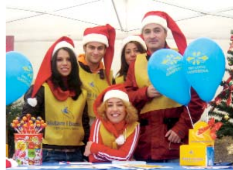
I volontari di Gasperina (CZ) impegnati nella terza edizione di “Babbo Natale per un giorno”, i giorni 1 e 2 dicembre 2007.

Al 31.12.2007 sono 22 i Referenti di “aiutare i bambini” sul territorio italiano. L'evento nazionale di piazza “Babbo Natale per un giorno”, alla sua terza edizione, ha contribuito allo sviluppo della rete di volontari, coinvolgendo oltre 1.500 volontari in tutte le regioni italiane.